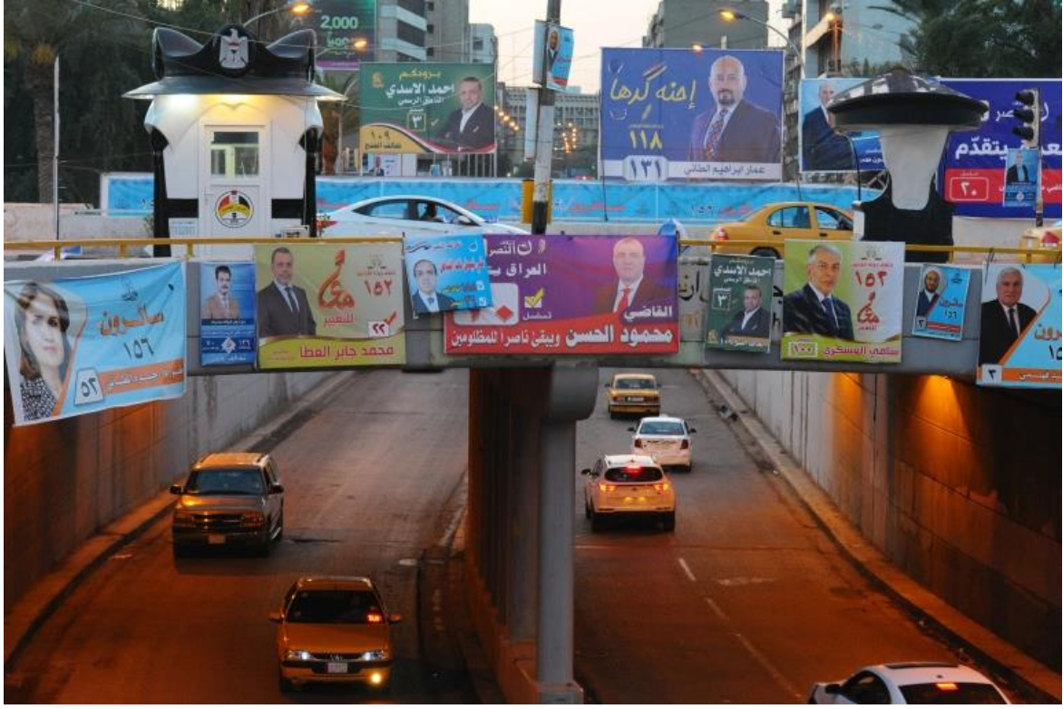
يشارك في الانتخابات العامة بالعراق 3249 مرشحا يتنافسون على 329 مقعدا